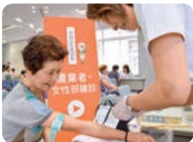
「農業者・女性部健診」を受ける女性