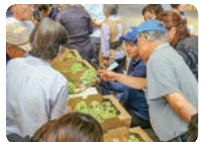
出荷規格を確認する生産者

JAしまねでは、激化する産地間競争に対応しようと、今年産から県下の「シャインマスカット」の共同計算を実施しています。一元的に管理して品質の高位平準化を図るとともに、ロットの拡大で売り場確保、県産「シャインマスカット」の地位向上を図ります。