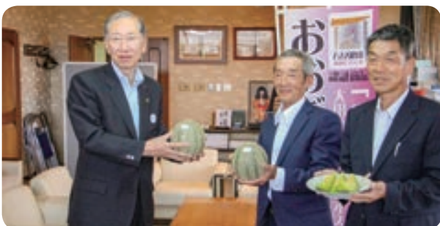
市長（左）にメロンを贈呈する岩倉組合長（中央）、厚朴副組合長

楢野市長は「暑い中の作業だが、体調に気をつけながら地域のために頑張っていたください」と激励しました。