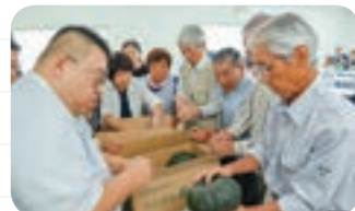
カボチャを手に取り状態を確認する参加者

今年度は共販面積を1.6haから3.5haに拡大。出荷量は92tを計画しており、出荷は8月末まで続きます。